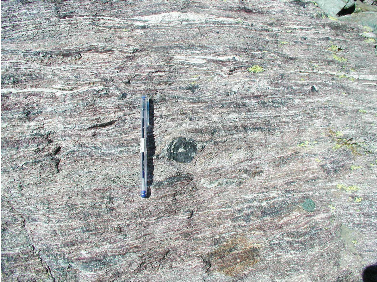
Quarzite a manganese